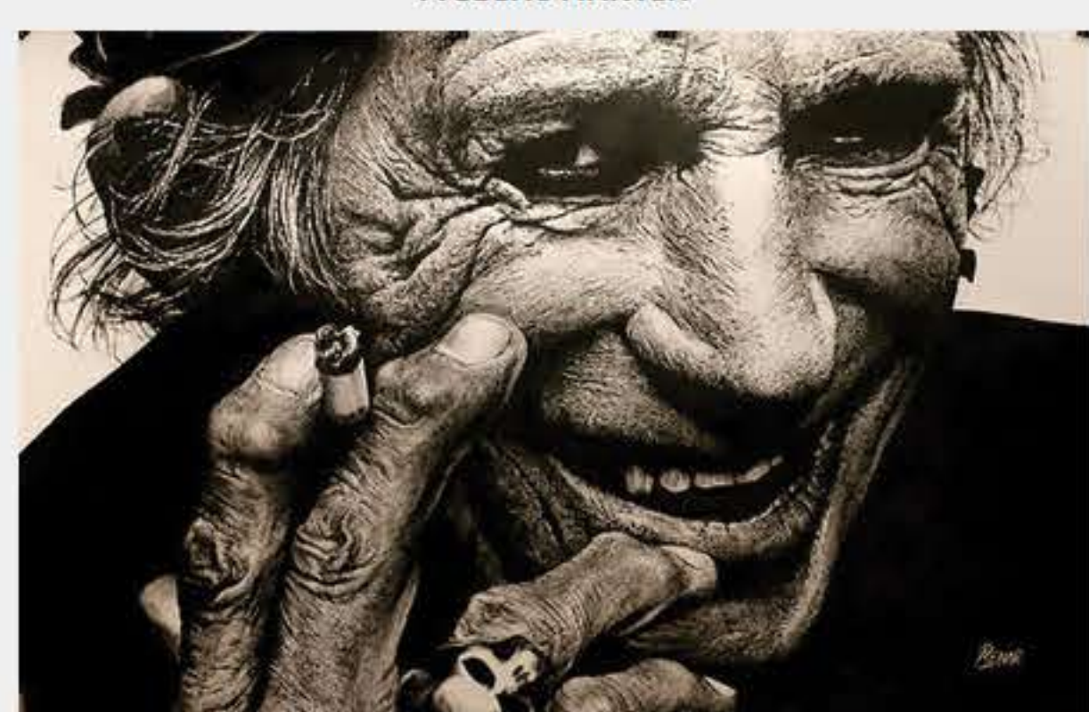
Prix Univers des Arts Pierre RENAR CHEVALIER