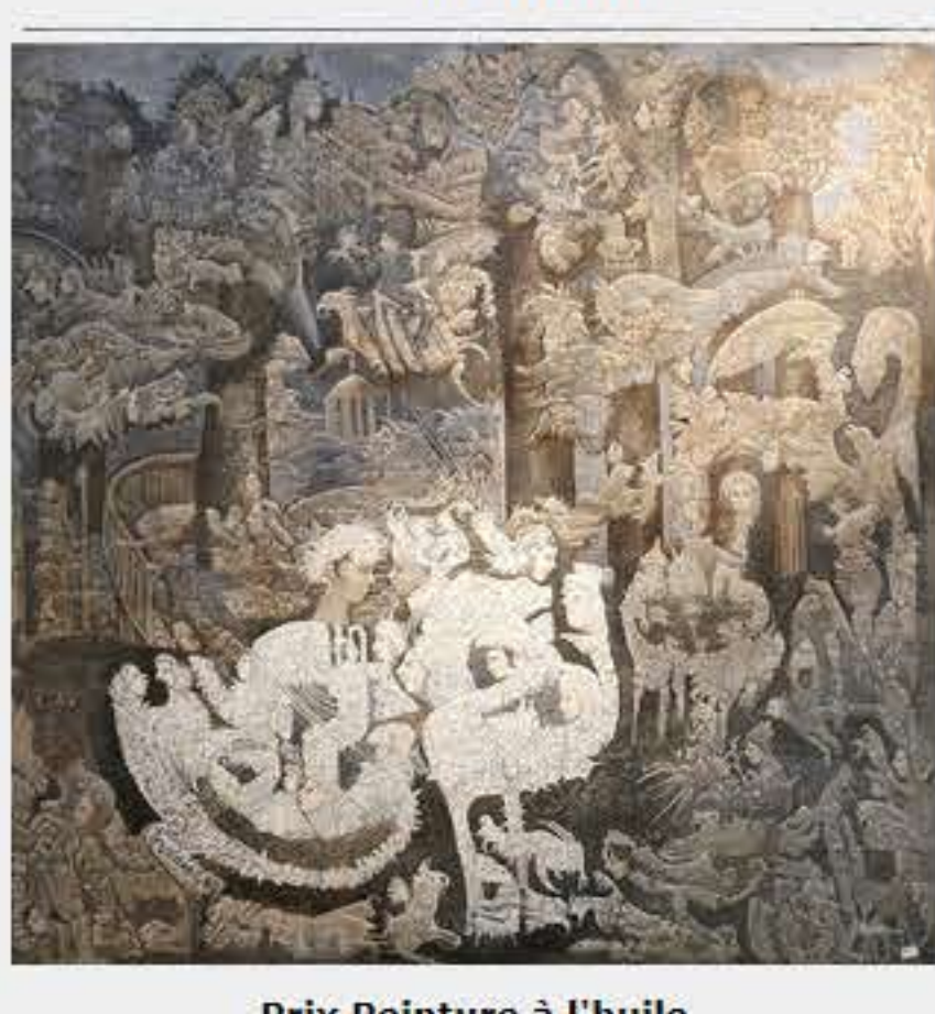
Prix Peinture à l'huile Adèle BESSY