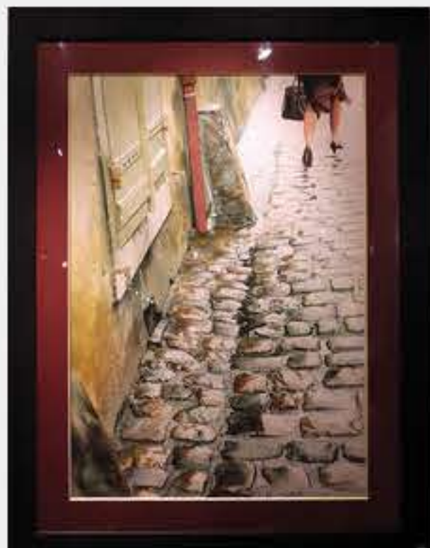
Prix de la Ville Georges ARTAUD