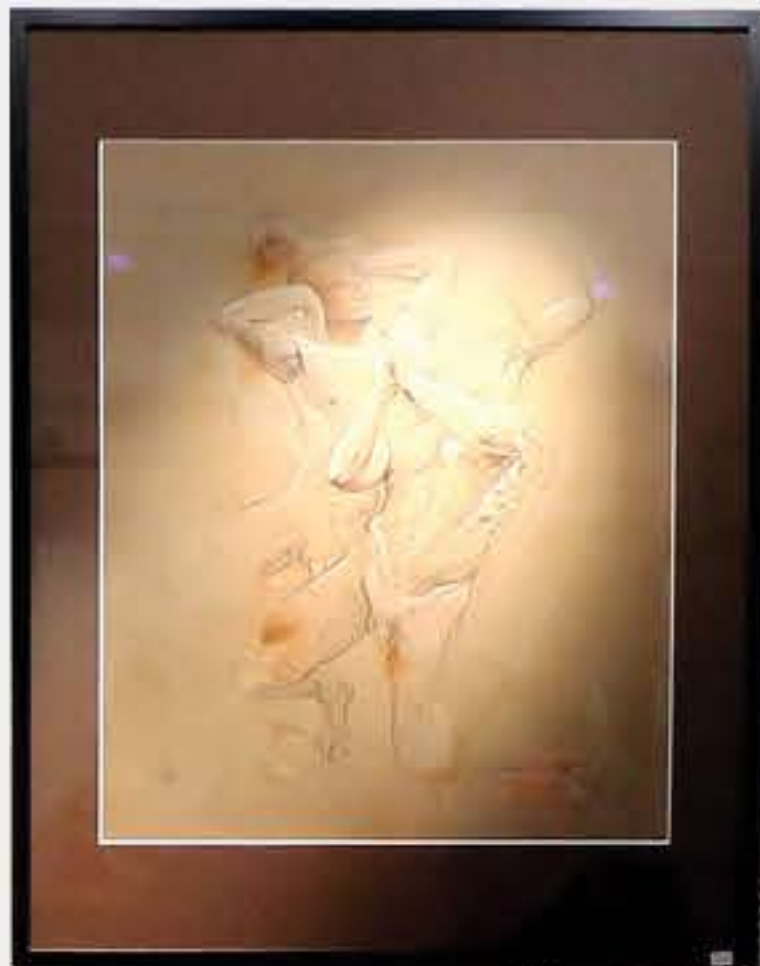
Prix de Dessin Frédéric MARTIN