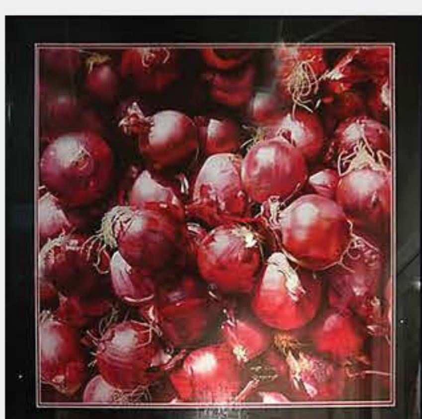
Prix du Pastel Jean-Pierre CHAGNIAUD